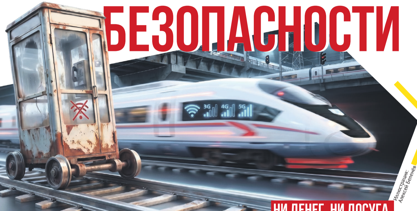
Иллюстрация: Алексей Беляев

Блокировки Интернета бьют по нервам и по карману миллионов наших сограждан. Ограничения доступа во Всемирную паутину объясняют соображениями безопасности. Но возможен ли вариант, когда и Интернет цел, и граждане надежно защищены? Партия СПРАВЕДЛИВАЯ РОССИЯ выступает за минимальные точечные ограничения – и только в тех случаях, когда они действительно необходимы.