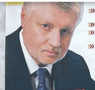
ЦЕНТР ЗАЩИТЫ ПРАВ ГРАЖДАН «СПРАВЕДЛИВАЯ РОССИЯ»

Центр защиты прав граждан (ЦЗПГ) – проект Партии СПРАВЕДЛИВАЯ РОССИЯ, который был запущен более десяти лет назад по инициативе Сергея Миронова и при поддержке Владимира Путина практически во всех регионах России. За прошедшее время специалисты ЦЗПГ помогли 17,3 миллиона россиян вернуть 75,7 миллиарда рублей невыплаченных алиментов, неверно рассчитанных платежей за ЖКУ и не только!