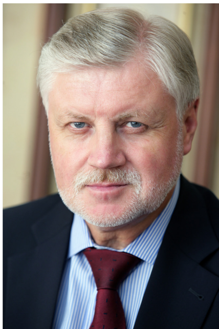
Лидер партии СПРАВЕДЛИВАЯ РОССИЯ , руководитель фракции « СПРАВЕДЛИВАЯ РОССИЯ » в Госдуме Сергей Миронов

высказал свое мнение о добровольном сложении депутатских полномочий несколькими депутатами-единороссами: