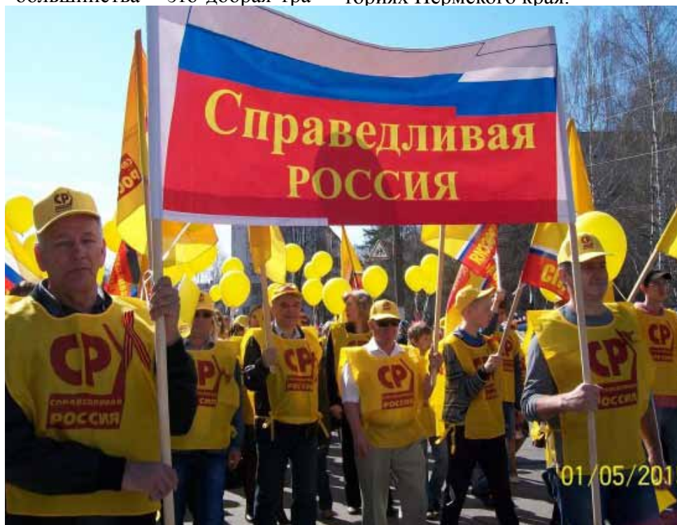
Демонстрация в Чайковском

Солнечные фотографии, позитивные отзывы, хорошее настроение – подарок, который достался всем участникам и организаторам праздничных событий в честь Первомая.