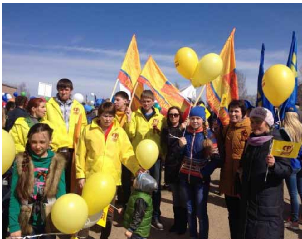
Демонстрация в Кудымкаре Коми-Пермяцкого округа