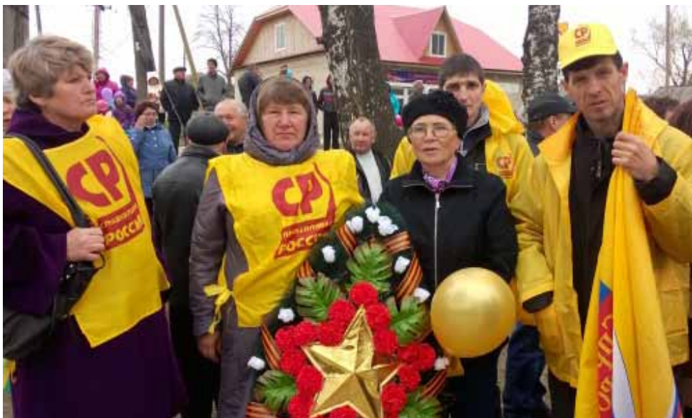
Возложение в Кишертском районе

Ко Дню Победы были приурочены спортивные соревнования: ежегодная эстафета имени