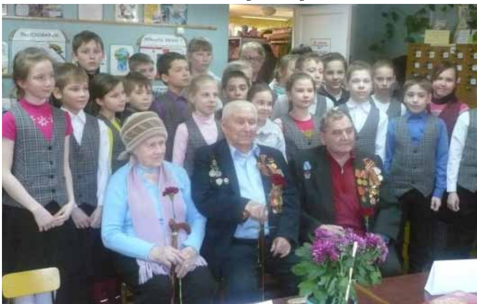
Уроки памяти в Чайковском районе